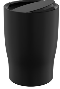
A4430039 Çöp kovası