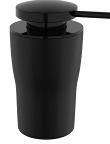
A4432039 Sıvı sabunluk