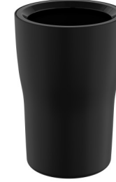
A4430139 Diş fırçalığı