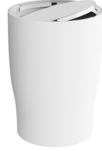
A4430057 Çöp kovası