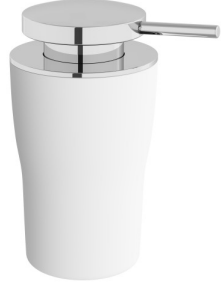
A4432057 Sıvı sabunluk