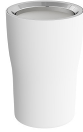
A4430157 Diş fırçalığı